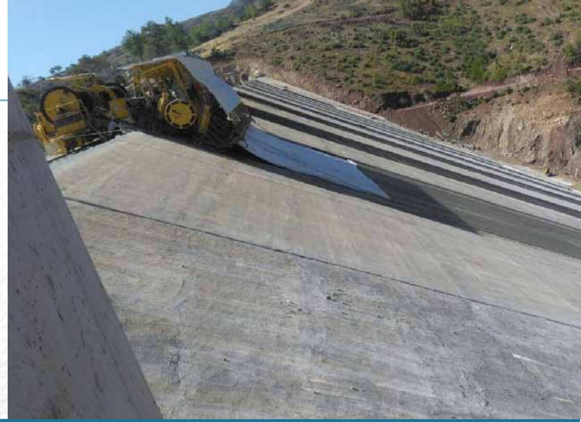
Çorum Kunduzlu Barajı İşveren | Best İnşaat